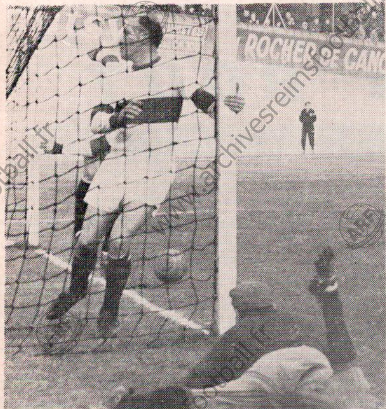
Dernière image du dernier match de Championnat à Reims : tous les Montpelliérains hors de position (et Dessons hors de son but !) et la balle va être poussée dans « la cage ».

— Chemister Spécialiste — 5, Rue Marx-Dormoy REIMS - Tél. 47-33-66