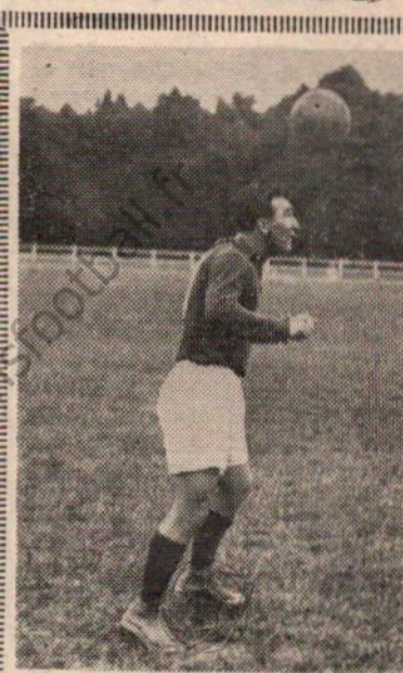
Cliché « l'Union ».

Par bonheur pour lui, on n'exécuta pas les Hymnes Nationaux à Colombes, dimanche, où il faisait ses débuts d'international.