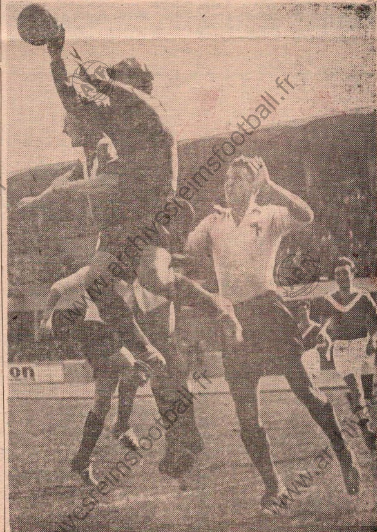
En bas : APPEL joueur