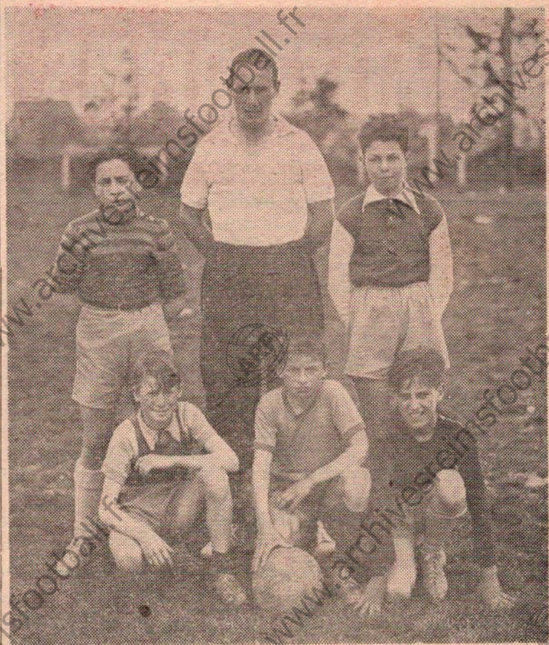
En haut : APPEL professeur

LE DREN (n° 11) , 22 ans. Comme son nom le laisse supposer, il est originaire de la Bretagne ainsi que la plupart de ses partenaires. Ailier rapide et efficace, qui doit encore s'améliorer. Joue habituellement dans l'équipe amateur, mais est appelé à figurer souvent parmi les pros.