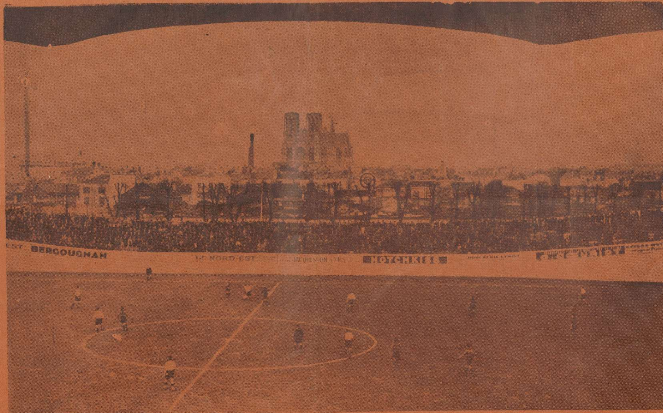
Vue panoramique du Stade-Vélodrome de Reims au cours d'un match disputé récemment. On remarque que le public nombreux se masse tout au long de la piste.

Cependant, il faut signaler que ce mouvement populaire en faveur du Stade est avant d'être un élan de chauvinisme, un mouvement sportif.