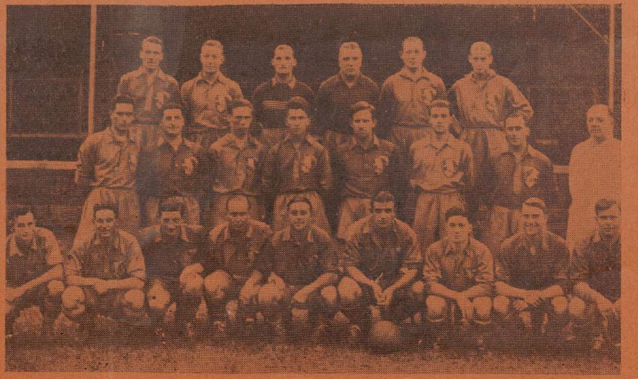
La pléiade des excellents joueurs du Football Club de Sochaux, champion de France professionnel Saison 1934-1935